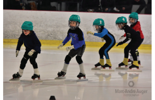
Les jeunes patineurs de vitesse âgés entre 5 et 10 ans ont pu démontrer leur savoir-faire lors de la finale C'LFun qui avait lieu, le 17 février dernier.